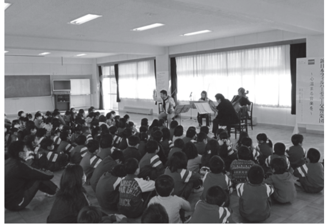
<宮城県宮古市立山口小学校>